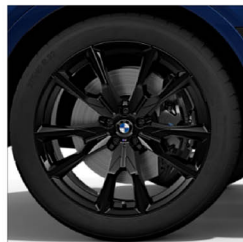
M V 輻式 755M