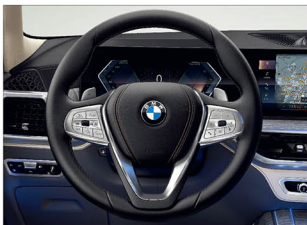
跑車多功能真皮方向盤 (含換檔撥片)