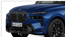
X7 M60i xDrive