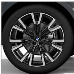
V 輻式 756