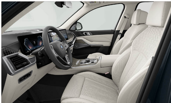
BMW Individual Merino 真皮 / 舒適型座椅 X7 xDrive40i