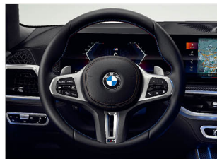
M 多功能真皮方向盤搭配專屬縫線 (含換檔撥片)