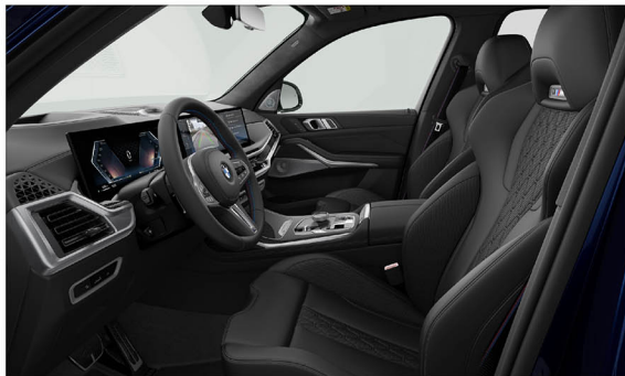
BMW Individual Merino 真皮 / M跑車座椅 X7 M60i xDrive